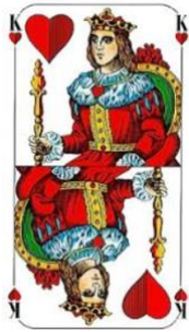
Max (höchste Karte)